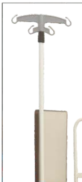
Porta suero regulable