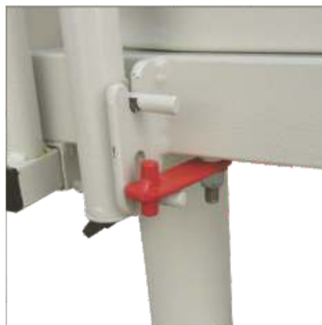
Dispositivo de traba para evitar levantar la baranda en forma accidental