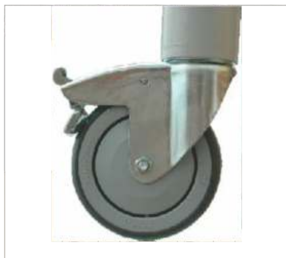
Ruedas con frenos independientes 125 mm